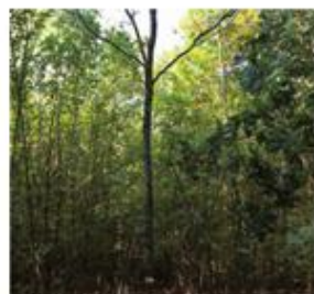
élagage d'arbre d'élite,