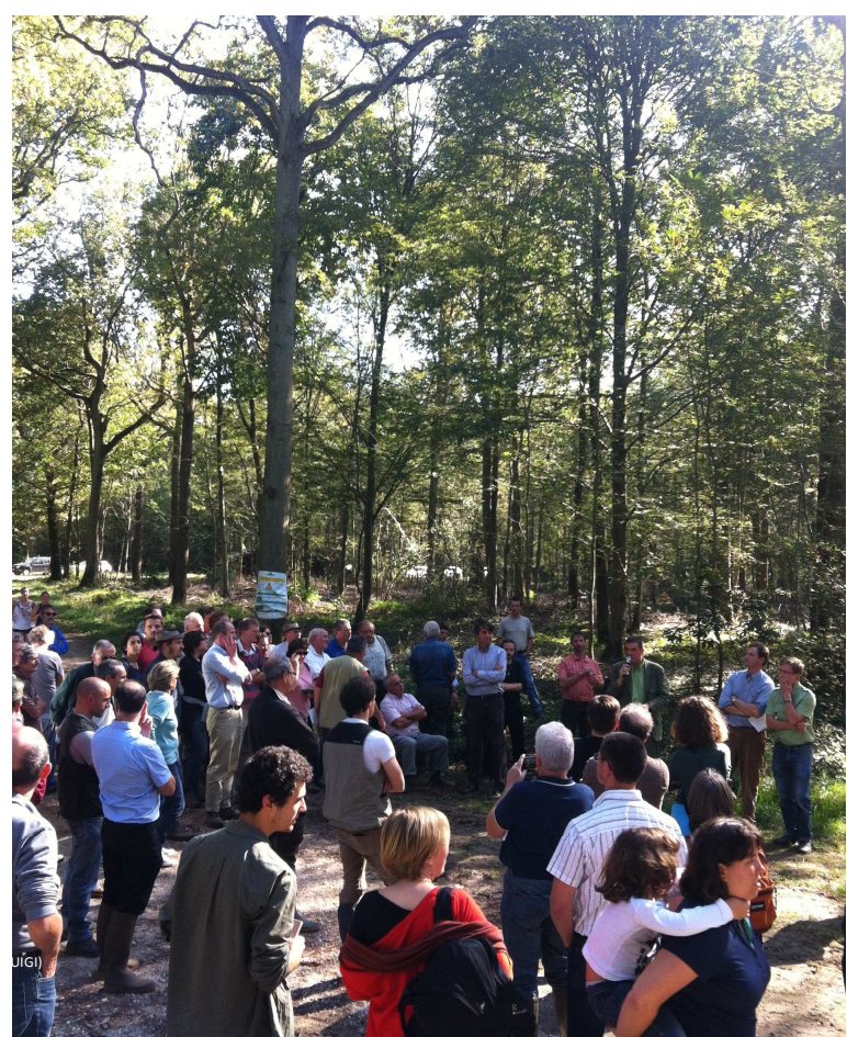
Une Assemblée Générale annuelle très suivie, samedi 27 septembre dernier, en Ile de France. Plus de 80 participants ont suivi les explications de nos hôtes, en forêts privées et publiques.

Newsletter N°22 – Juillet-Août-Septembre 2014