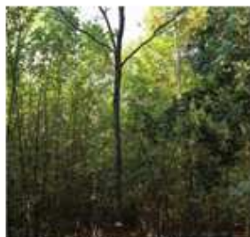
élagage d'arbre d'élite,